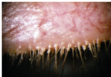
Schilfers bij (anterieure) blefaritis

Bij anterieure blepharitis is met name het gebied rondom de basis van de ooglidharen aangedaan, waardoor er schilfers en korstjes tussen de wimpers ontstaan.